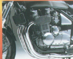
● Durchzugsstark: der luftgekühlte Vierzylinder-Reihenmotor.