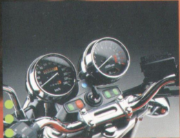
Klar und übersichtlich: die Instrumente.