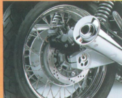
● Klassisch und edel: die verchromten Speichenräder.

Die Zephyr 1100 unterschreitet schon heute die ab 1997 geplanten EG-Abgasgrenzwerte und ist mit einer elektronischen Diebstahlsicherung ausgestattet, die ein problemloses Kurzschließen verhindert.