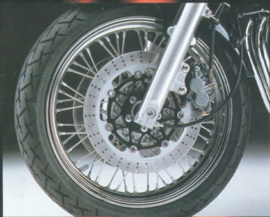
● Motorleistung groß, Bremsleistung groß: die Doppelscheiben-Bremse mit Zweikolben-Bremszange.

Die Ausstattung der Zephyr 1100 stimmt bis ins Detail: zum Beispiel die Gepäckhaken, der verchromte Tankdeckel, der solide Haltegriff für den Beifahrer, die breite Sitzbank sowie die verstellbaren Handhebel für Kupplung und Bremse.