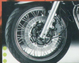
Klassisch: die verchromten Speichenräder.