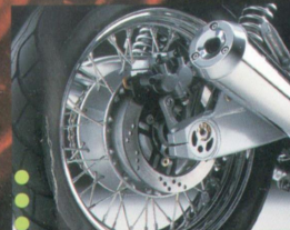
Individuell einstellbar: die Federung am Hinterrad mit zwei Stoßdämpfern.